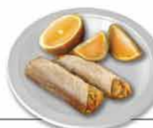
Laranja de Ermelo e Charutos dos Arcos Referência fundamental