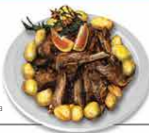
Cabritinho Mamão da Serra Um assombro de paladares