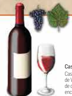
Casta Vinhão Casta regional tintureira, para a produção de Vinho Verde tinto, dá origem a vinhos de cor vermelha granada, vinosos, encorpados, harmoniosos e saborosos.