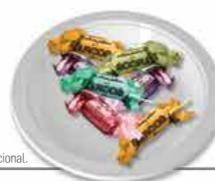
Rebuçados dos Arcos