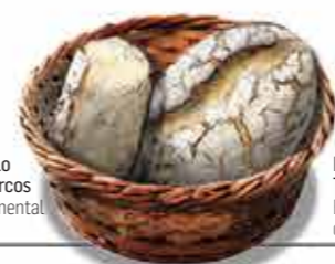
Broa de Milho Tradicional Eleva o bom nome da gastronomia nacional.