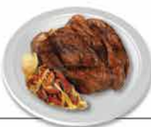
Carne Cachena Tenrura, suculenta e de sabor único.

A gastronomia é riquíssima, um autêntico assombro de paladares! Desfrute do Cozido à Minhota, do Cabritinho Mamão da Serra e da Carne da Cachena com Arroz de Feijão Tarrestre. O Pica no Chão não esquecendo os Enchidos e Fumados Caseiros