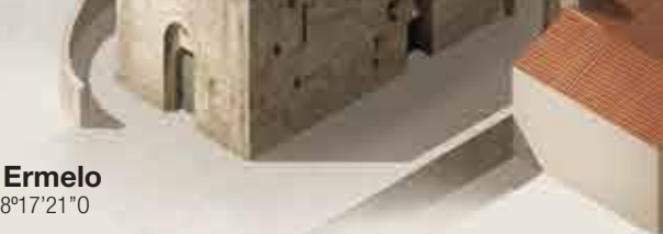
B Mosteiro de Ermelo