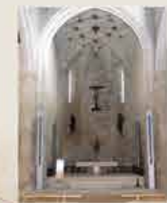
Igreja Matriz de Caminha D

GPS - 41.87811588 | -8.83742423 Autêntico ex-libris da vila de Caminha teve, provavelmente, duas fases de construção, a primeira das quais iniciadas em 1428 e a segunda em 1488. A sua construção foi terminada já no reinado de D. Manuel I.