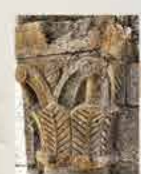
Pormenor de coluna de estilo românico.